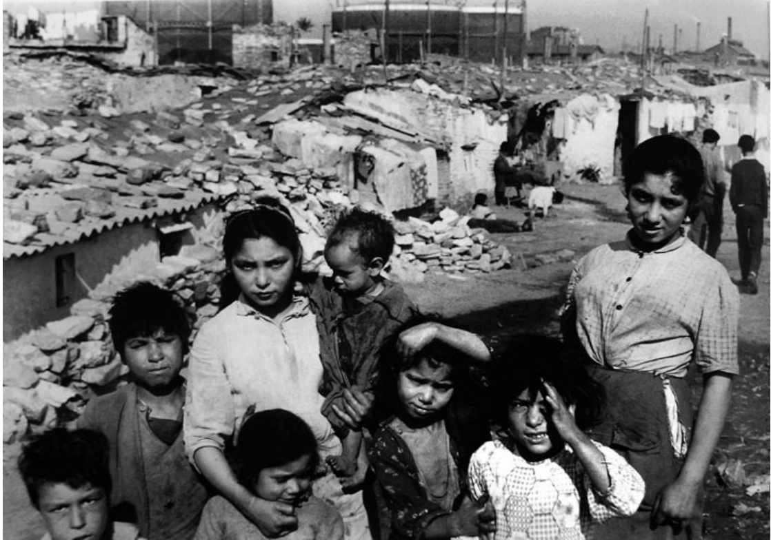
Barracas y miseria.