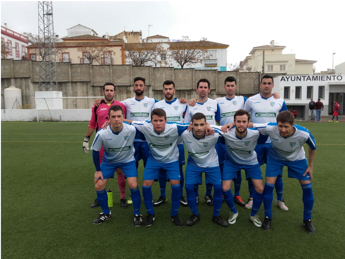
Equipo de Facinas.